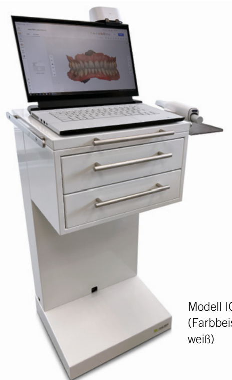
Modell IOS Cart XL (Farbbeispiel weiß)

Hinweis: Erhältlich in 2 Farben (weiß und anthrazit/individuell RAL Farbe kostenpflichtig möglich). Gerätecart ist bereits vormontiert und wird im Karton angeliefert.