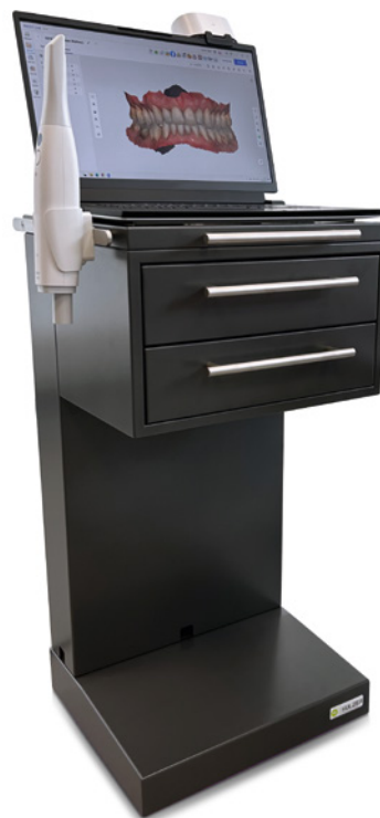
Modell IOS Cart (Farbbeispiel anthrazit)

Hinweis: Erhältlich in 2 Farben (weiß und anthrazit/individuell RAL Farbe kostenpflichtig möglich). Gerätecart ist bereits vormontiert und wird im Karton angeliefert.